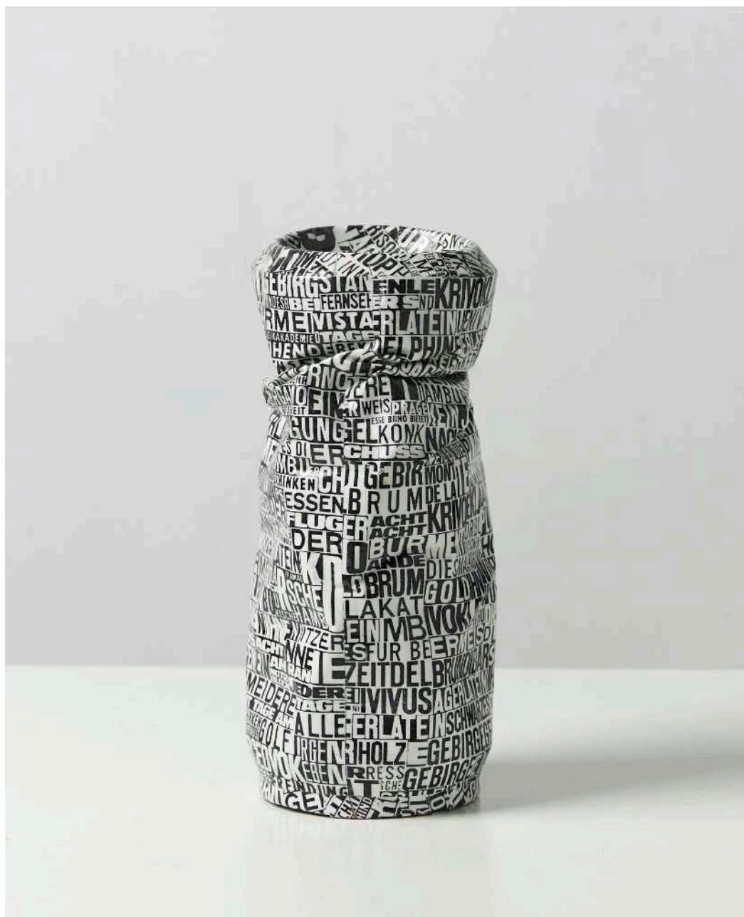
Karel Trinkewitz Senza titolo , 1995 Collage su lattina 15 cm.